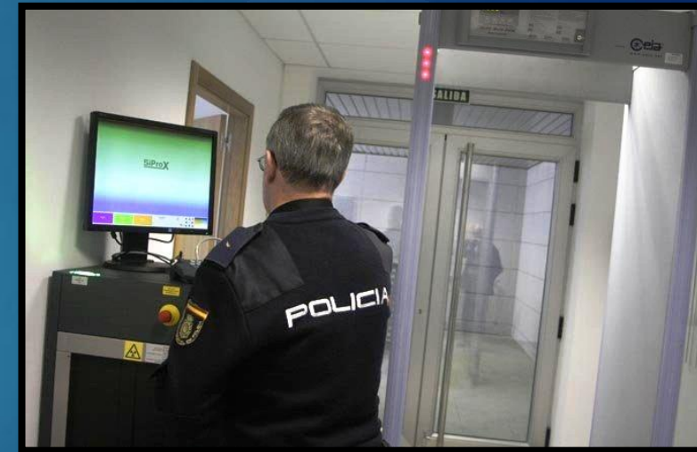
Los cometidos de los puestos de seguridad (vigilancia de instalaciones y control de accesos), una parte más de la labor de las Brigadas de Seguridad Ciudadana

Igualmente, pese a que se da por hecho que los funcionarios están capacitados para su utilización, sería interesante mejorar y actualizar la formación en relación a la utilización de estos medios materiales, especialmente los escáner de seguridad, pues saber diferenciar las diferentes tonalidades que las diferentes materias arrojan al monitor es vital para la correcta utilización de los mismos.