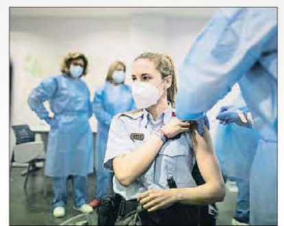
La vacunación de los Mossos empezó en febrero